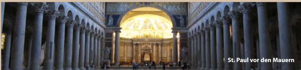
St. Paul vor den Mauern

Besichtigungsprogramm: Aventin, S. Sabina (mit wundervollen Holztüren aus dem 7. Jhd), San Anselmo, Piazza die Piranesi und das „Schlüsselloch“, Circus Maximus, S. Maria in Cosmedin (mit dem „Bocca della Verità“), Trastevere, Piazza Campo dei Fiori (wo im Jahre 1600 der Astronom und Philosoph Giordano Bruno durch die Inquisition auf dem Scheiterhaufen hingerichtet wurde), Palazzo Farnese . Besuch in der Deutschen Botschaft und Empfang durch die deutsche Botschafterin beim Heiligen Stuhl, Annette Schavan (genauer Zeitpunkt und Programmablauf wird kurzfristig bekanntgegeben). Gemeinsames Abendessen.