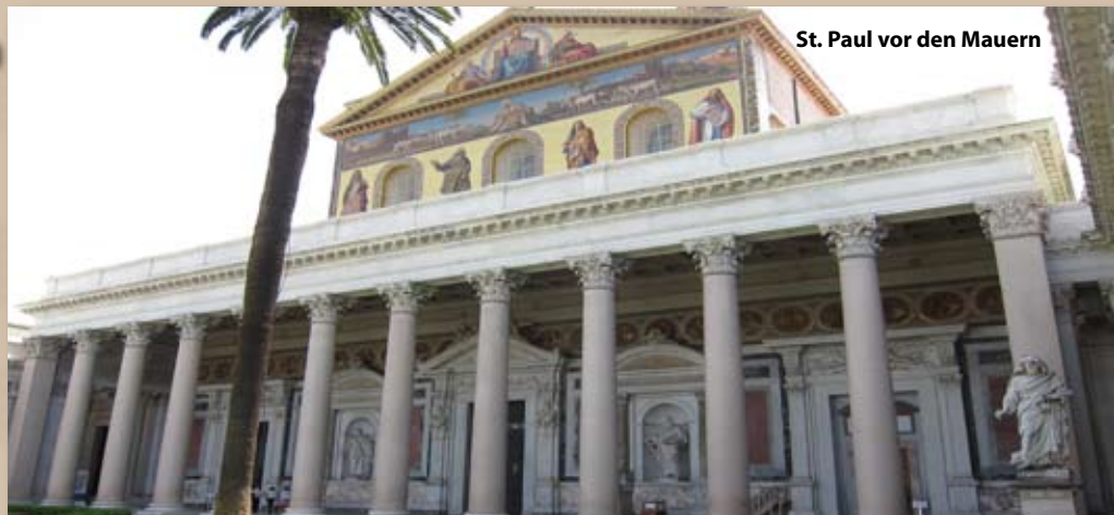
St. Paul vor den Mauern