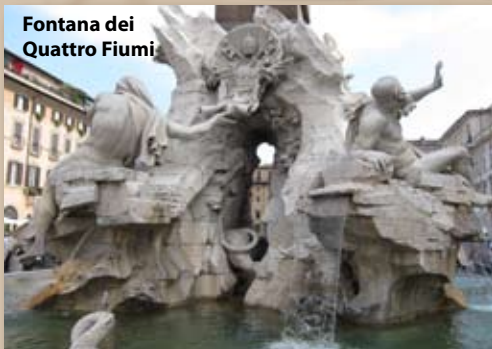
Fontana dei Quattro Fiumi

Besichtigungsprogramm: Aventin, S. Sabina (mit wundervollen Holztüren aus dem 7. Jhd), San Anselmo, Piazza die Piranesi und das „Schlüsselloch“, Circus Maximus, S. Maria in Cosmedin (mit dem „Bocca della Verità“), Trastevere, Piazza Campo dei Fiori (wo im Jahre 1600 der Astronom und Philosoph Giordano Bruno durch die Inquisition auf dem Scheiterhaufen hingerichtet wurde), Palazzo Farnese . Besuch in der Deutschen Botschaft und Empfang durch die deutsche Botschafterin beim Heiligen Stuhl, Annette Schavan (genauer Zeitpunkt und Programmablauf wird kurzfristig bekanntgegeben). Gemeinsames Abendessen.