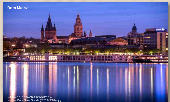
St. Maria und St. Clemens

Den heutigen Tag verbringen wir noch einmal in Mainz. Unweit des Domes befindet sich die Kirche St. Quintin, die älteste Pfarrkirche der Stadt. Dort halten wir ein kurzes Morgenlob, bevor wir uns auf einen unterhaltsamen Rundgang durch die Altstadt machen – den Dom immer im Blick – und einige heitere „Meenzer Geschichtsscher“ hören werden! Nach der Mittagspause fahren wir zur Zentrale des ZDF auf dem Mainzer Lerchenberg und erfahren dort bei einer Backstage-Führung Einiges über das öffentlich-rechtliche Fernsehen. Zurück in der Mainzer City beschließen wir das heutige Tagesprogramm mit der Vesper in der prächtigen Rokoko-Kirche St. Peter. Rückfahrt ins Hotel und Abendessen.